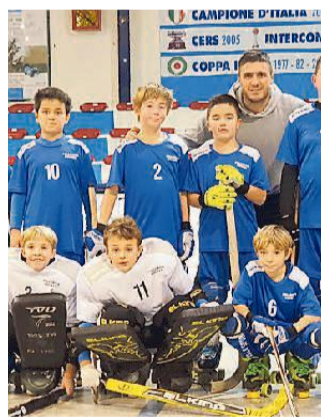
Alcuni degli hockeisti Under 11

I ragazzi di mister Bracali, grazie al successo in Liguria per 3-7, si sono piazzati al secondo posto ad un solo punto dalla vetta occupata dal Pumas Viareggio risultando a lungo la squadra da battere e alla quale tutte le altre contendenti hanno dovuto almeno una volta inchinarsi. Un campionato molto combattuto al quale ha partecipato con un gruppo molto affiatato che ha saputo, nel corso della stagione, affrontare unito i momenti di difficoltà che si sono presentati. Tutti i ragazzi hanno dimostrato impegno e voglia di giocare al meglio, voglia che li ha portati a compiere un'ottima prestazione anche al torneo Città di Bassano che si è svolto a fine dicembre nella città vicentina. Adesso è il momento della fase finale che decreterà chi delle quat-